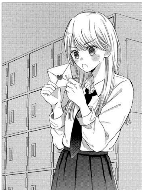
かわいらしく完成度の高い絵。トーンワークに注意。

るとんでもない奴だ。もう絶対だまされないと思っていたのに：!? 【絵】：絵だけで見れば即戦力レベルの完成度。奇り引き・構図のバリエーションも豊富で表情も豊かですね。今の読者に受け入れられそうな絵柄を研究しているのも感