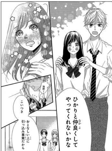
シンプルで見やすい絵柄だが色気も欲しいところ。

「絵」…シンプルで見やすい絵柄ですが、やや古さも感じます。男子のポカんと空いた口の描き方や