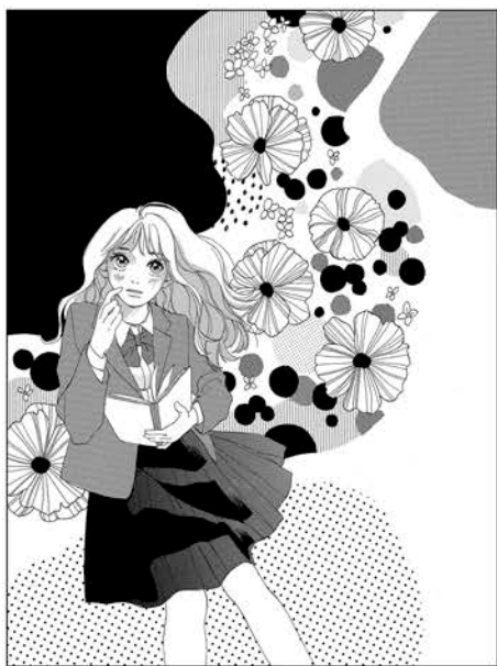
構図を工夫する姿勢はグッド。絵柄の改善をしよう。

が好きみたい。数学の課題を教えることになって、少しずつ彼に惹かれていく自分に気付いたけど!? 【絵】：特定の先生の影響を強く感じます。色気もあるしハツとするような構図を描けているのはとても良いですね。男女共に唇と鼻