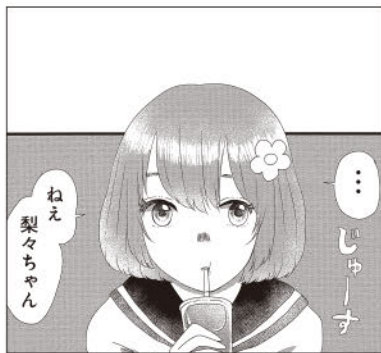
…じゃーす ねえ、梨々ちゃん ほのぼのした絵柄ですがやや子供っぽさも。

「絵」：絵が子供っぽく見えるので、読者が求める絵の追究を。横長のコマを多用するのはテンポ感が出ますが効果的に使われていない箇所もあるので、コマ割も要研究。日常系を描くなら小物や背景も重要なので、世界観まで伝わるように細かい絵の勉強もしよう。 「ストーリー」：男子に出会うまでが長く、話の進みが遅いです。恋を求めていたはずなのに恋じゃない関係を得て終わり、というのが話の展開として入り口と出口が違ってしまったと思います。お話を通して何を描きたいのかの整理を。