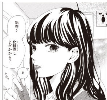
ハイレベルな画力! ツヤ感が良いです!

「絵」…メイクにこだわりのある主人公という設定を表現できるだけの画力があります。お人形のように整った女子の顔が魅力的でした。ただ、やや表情が固いシーンも見られるので、美しさだけでなく可愛らしさも表現できるようにするのがいいですね。男子も顔は整っていますが、ビジュアル面でもう一步工夫があると(人物を象徴する持ち物や髪型、制服ならその着崩し方など)尚良かったです。