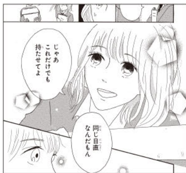
同じ日画 なんだもん じゃあ、これだけでも持たせてよ 白すぎる画面は救く見えるので要注意!

「絵」：画面が全体的に白く寂しく見えます。描線のメリハリ、背景の描き込み、テッサンの正確さなど課題は山積みなので、ひとつひとつ目標を決めて練習を重ねましょう。男女共に白髪はなるべく避けて、片方はベタかトーンにするなど最低限の工夫をしてみてください。 「ストーリー」：主人公の気づきや男子の魅力は十分1本のお話になる題材なので、もっと細かい所に目を向けて。彼の一挙手一投足がいちいちキラキラして素敵に見えるような、恋の素敵さを白井さんなりに描いてみてください!