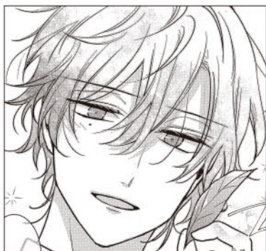
押し強い男子のキャラデザは武器です!

「ストーリー」…「惚れ薬を先輩が飲んだ」という冒頭から全てが予想通りに展開してオチも目新しいものではないので、新鮮味が欠ける印象です。ただ、このハチャメチャな勢いは武器なので、いつそもつと突き抜けてギャグやコメディの度合いを強くして、他の誰にも描けないハイテンションコメディを目指してみるのも手かもしれません。自分の武器と描きたいまんがをもう一度考えてみて。