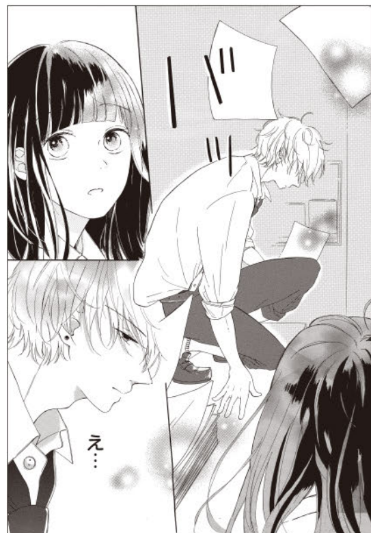
印象的な登場シーンで描みはパッチリ。紙が舞うのもグッド◎