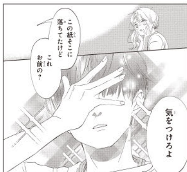
気をつけろよ この紙をここに落ちてたけど、これお前の？ 体重を見ない気遣いが面白く描けています。

「絵」：絵柄が不安定で、ページごとに顔が違って見えたり、体型も太って見える絵とそつでもない絵が混在しています。描線の雑さも気になるので、ひとつひとつの絵を丁寧に仕上げる意識を。男子の瞳が怖く見えるのもマイナス。 「ストーリー」：卑屈になりがちなたってている主人公という設定を好感が持てるように描けていました。体重を見ないという男子の気遣いもコマディを交えて描けていて、人を不快にさせないお話作りはとても良いです。オチが弱く読後感が物足りなかったのは残念。