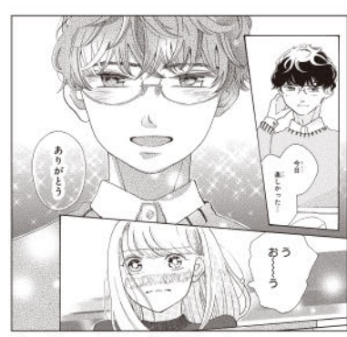
恋が始まる瞬間を印象的に描けています!

のクラスの橋下くんと一緒に課題をやることに。口が悪くて残念イケメンだと思ってたけど、同じ映画を好きだと知ってから急接近!!一緒に映画を見に行くことに…!? 〔絵〕…前回に比べてとても見やすい絵柄になりました。着実な努力の跡を感じます! とはいえまだ描線の不安定さや頭身のバランスの崩れが気になる箇所があるので、引き続き改善していきましよう。きちんとページのめくりを意識したコマ割ができているのは素晴らしいです。アップで良い表情を入れる意識もできているので、この調子でどんどんレベルアップを目指してがんばってください! 「ストーリー」…オタク友達に彼氏ができて寂しい…という冒頭は