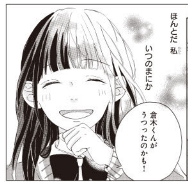
ふにやっとした、柔らかな笑顔が魅力的!

ベルと言えます。背景も上手! 「ストーリー」…流れに大きな穴 はないのですが、キャラが設定だ けになってしまい作り物感が出て しまっています。「周囲の期待に