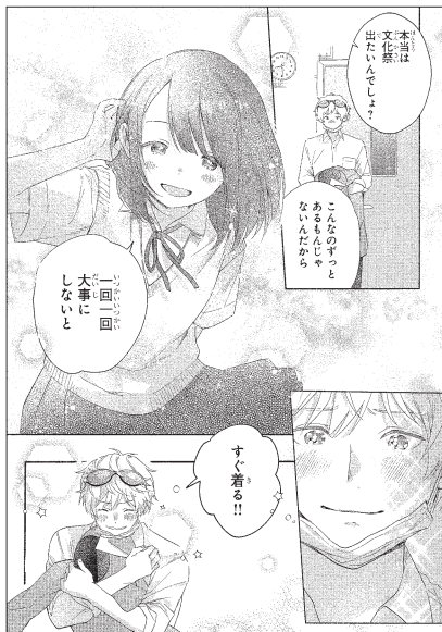
もやがかって見えます。ベタで引き締めて!

「絵」と「コマ割り」…画力はデビューレベルです。女の子はデザイン・演出・エピソードいすれもよく描けているのですが、男の子の描写がイマイチです。また、コマ割りの読みづらさが目立ちます。コマが多く、人物が小さいです。顔のアップ