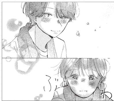
初々しいふたりの空気感が描けていました。

「総評」: 推しと恋愛の違いって何というテーマは今っぽくて。ただ、自分を好きだと言う相手にどう返事をするか、という小さい話になってしまった印象です。絵柄は、男女の描き分けが弱いので骨格から全然ちがう点に着目して。